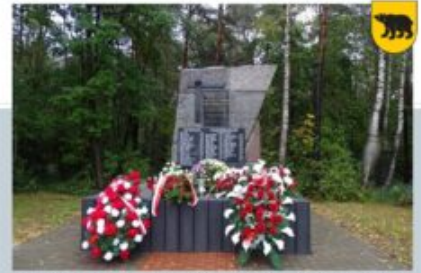
RODZINNA WIOSNA W BUDZISKACH - STOWARZYSZENIE NA SZCZĘ ROZWOJU WSI BUDZISKA, 22 WRZEŚNIA