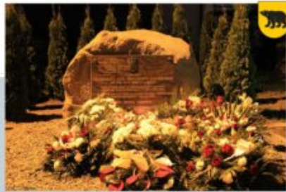
ODŁONIECIE POMNIKÓW W LIPINACH - TOWARZYSTWO PRZYJACIÓŁ WOLI GULÓWSKIEJ, 5 PAŹDZIERNIKA