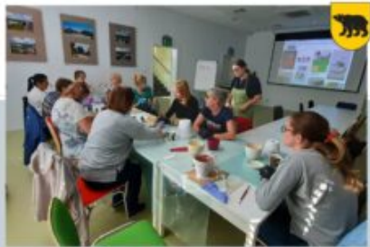
WARSZTATY - UNIWERSYTET ŁÓDZKI W ADAMOWIE, 8 PAŹDZIERNIKA