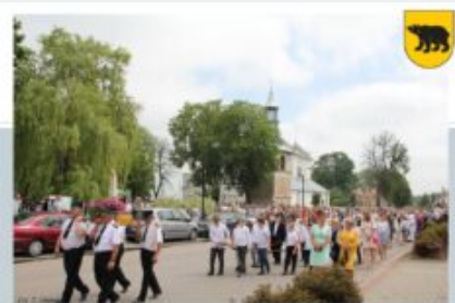
PROCESJA BOŻEGO CIAŁA - OSP ADAMÓW, 11 CZERWCA