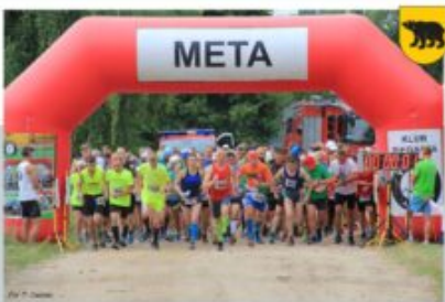
IX POLMARATON TRADYCJI - KLUB BIEGACZA V MAY, OSP ADAMÓW, OSP NORDZIEŻKA, OSP WOLA SUŁOWSKA, 4 LIPCA