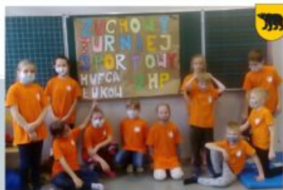
ZUCHOWY TURNIEJ SPORTOWY - ZHP SOZ WESOŁE PROMYKŁY, 24 PAŹDZIERNIKA