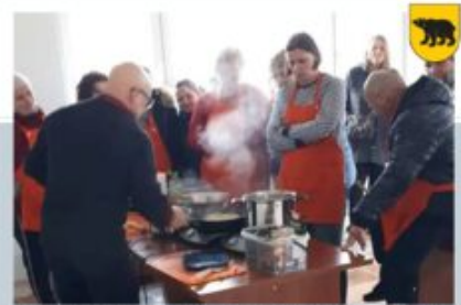
WARSZTATY KULINARNE - SPÓŁDZIELNIA SOCJALNA NIEOŻWIĄDEK, 3 MARCA