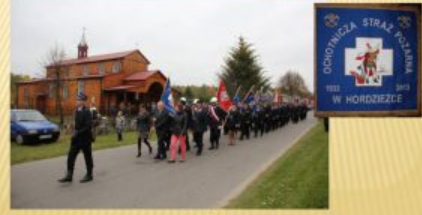
OCHOTNICZA STRAZ POZARNA W HORDZIEZCE (1933)