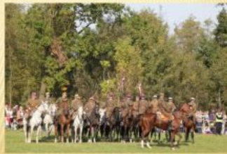
TOWARZYSTWO PRZYJACIÓŁ WOLI GULOWSKIEJ (2008)