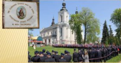
OCHOTNICZA STRAZ POZARNA W WOLI GULOWSKIEJ (1925)