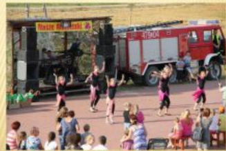
STOWARZYSZENIE PRZYJACIÓŁ GMINY ADAMÓW „JEDNOŚĆ” (2008)