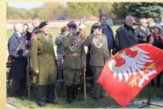
STOWARZYSZENIE PAMIĘCI CZYNÓW BOJOWEGO KLEBERCZYKÓW (1992)