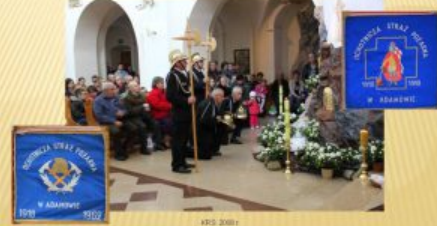
OCHOTNICZA STRAZ POZARNA W ADAMOWIE (1918)