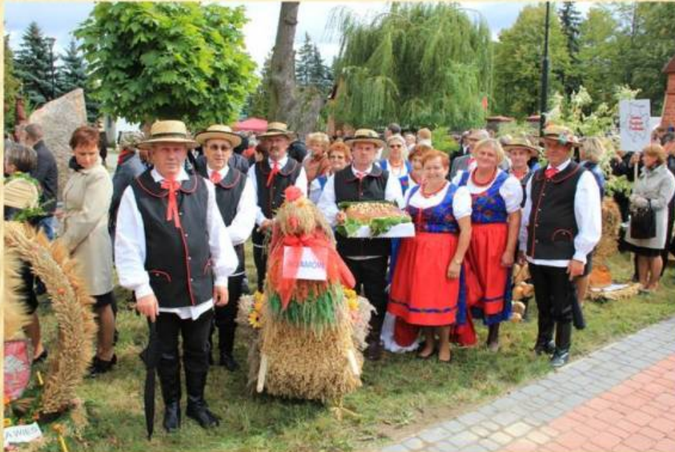
KRS: 2015 r.