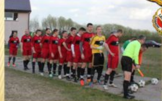
LUDOWY KLUB SPORTOWY „SOKÓŁ” W ADAMOWIE (1949)