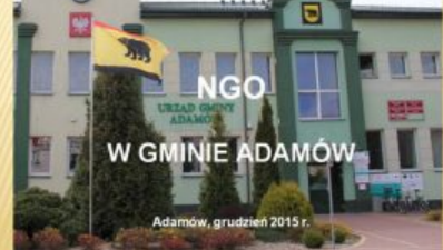
NGO W GMINIE ADAMÓW