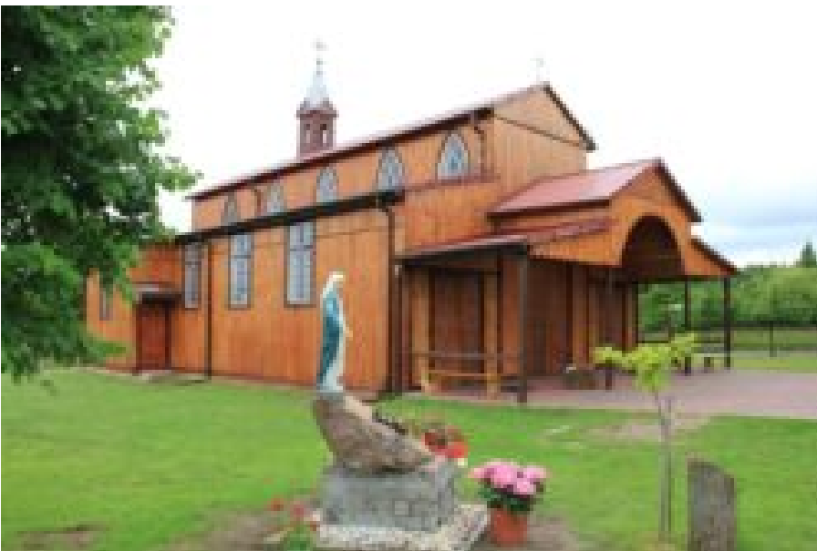
Hordzieżka-kaplica Świętego Jana Chrzciciela