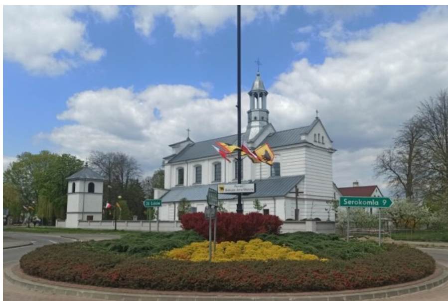
Adamów-kościół pod wezwaniem Podwyższenia Krzyża Świętego