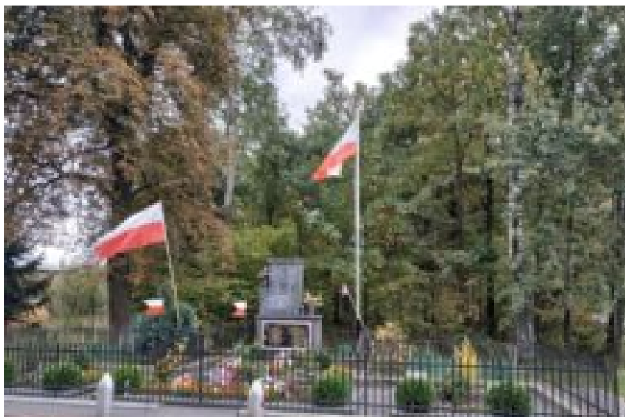
Helenów-mogiła żołnierzy SGO Polesie