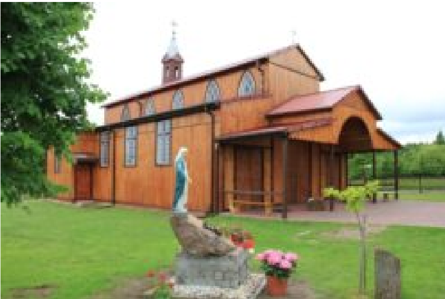
Hordzieżka-kaplica Świętego Jana Chrzciciela