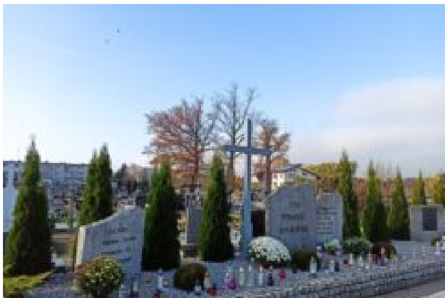
Adamów-kwatery żołnierskie na cmentarzu parafialnym