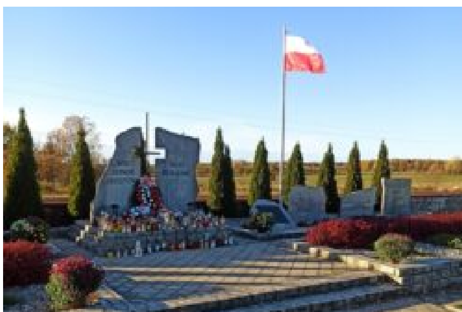
Wola Gułowska-kwatery żołnierskie na cmentarzu parafialnym