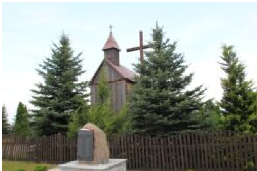
Zakępie-kaplica świętych Apostołów Piotra i Pawła