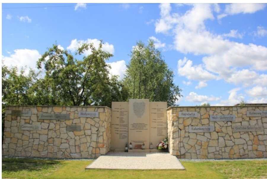
Kalinowy Dół-pomnik Pułku Trzeciego Strzelców Konnych