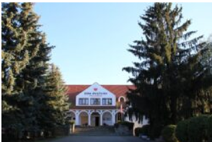
Wola Gułowska-Dom Kultury-Pomnik Czynu Bojowego Kleeberczyków