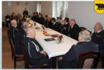
BALNE ZEBZBANIA CZŁONKÓW OSP ADAMÓW, OSP PĘDZYKARDÓW, OSP NORDZIEŻKA I OSP WOLA SUŁOWSKA - OSP ADAMÓW, 15 LUTEGO