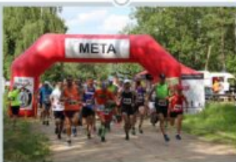
Organizacje pozarządowe w Gminie Adamów w 2020r.