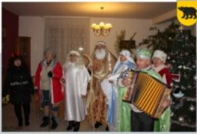
KOLELOWANIE - MODRY LEN, 6 STYCZNIA