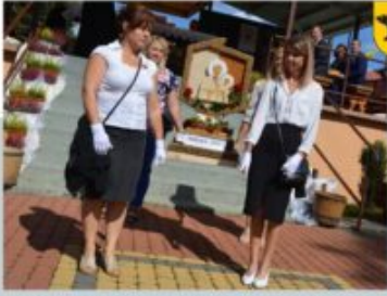
BOŻYNI DIECEZJALNE - STOWARZYSZENIE PRZYJACIÓŁ GMINY ADAMÓW „JEDNOŚĆ” W SOBIECIE, 8 WRZEŚNIA