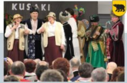
ZAGŁOBA ŚWATEM - MODRY LEN, 23 LUTEGO