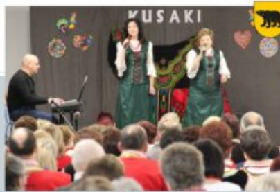
KUSAKI - SZALINÓWKA, 23 LUTEGO