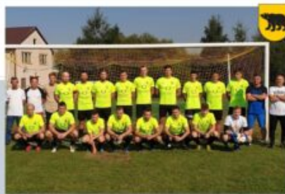
ROZGRYWKI PIŁKI NOŻNEJ, LKS SOKÓŁ WIGNA - JESIEŃ