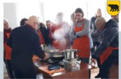
WARSZTATY KULINARNE - SPÓŁDZIELNIA SOCJALNA NIEOŻWIĄDEK, 3 MARCA