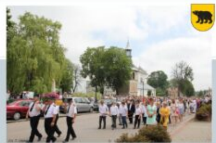
PROCESJA BOŻEGO CIAŁA - OSP ADAMÓW, 11 CZERWCA