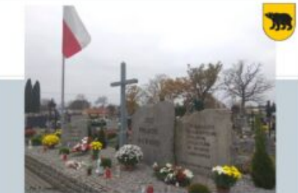
DZIEŃ NIEPODLEGŁOŚCI, 11 LISTOPADA

Tagi: klub , ngo , organizacje , osp , stowarzyszenia