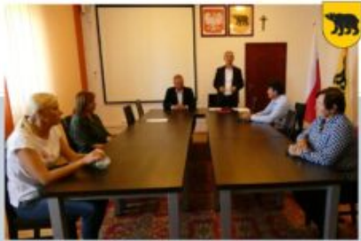
POWOLANIE GMINNEJ RADY DZIAŁALNOŚCI POŻYTKU PUBLICZNEGO - ADAMÓW, 23 WRZEŚNIA