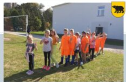
UPOWSZECHNIANIE KULTURY FIZYCZNEJ - ULKS „ORŁY”