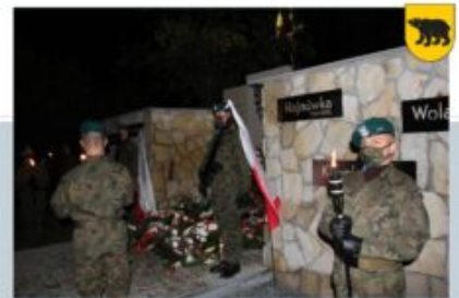
UROCZYSTOŚCI KLESZCZYKOWSKIE - TOWARZYSTWO PRZYJACIÓŁ WOLI GULÓWSKIEJ, 5 PAŹDZIERNIKA