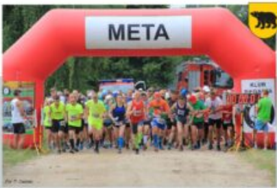
IX POLMARATON TRADYCJI - KLUB BIEGACZA V MAY, OSP ADAMÓW, OSP NORDZIEŻKA, OSP WOLA SUŁOWSKA, 4 LIPCA