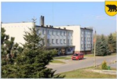
TRADYCJE WIELKANOCCNE, ŁANY POWIEŚZIAŁEK - OSP ADAMÓW, 13 KWIETNIA