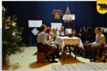
W MACIEJÓW NA GODY - ZESPÓŁ OBRĘDOWY ZAWSZE RAZEM, 19 WRZEŚNIA