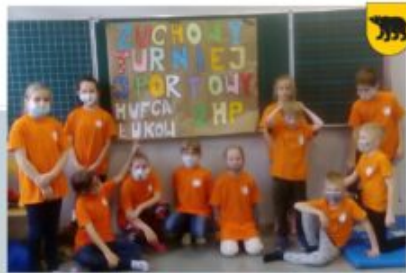
ZUCHOWY TURNIEJ SPORTOWY - ZHP SOZ WESOŁE PROMYK, 24 PAŹDZIERNIKA