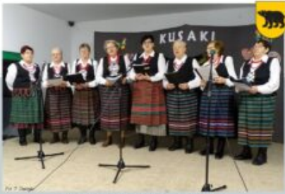
KUSAKI - POLNE KWIATY, 23 LUTEGO