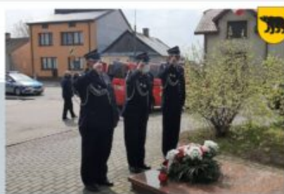
OBCHODY 3 MAJA - OSP ADAMÓW, 3 MAJA